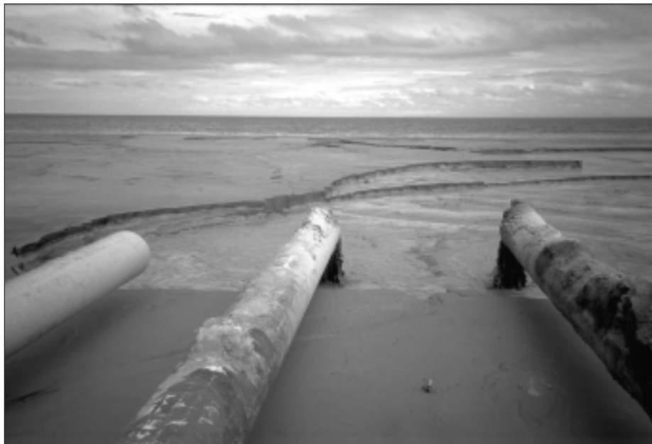
Tubería depositando desechos de la mina Marcopper en la bahía Calancan, Filipinas.

Un total de 200 millones de toneladas métricas de desechos fueron derramados hacia la superficie de la bahía Calancan, en el período de 1975-1991. Hoy en día los corales, los manglares, la hierba marina y los arrecifes están enterrados bajo una capa de escoria de 60 metros de profundidad. 2,000 pescadores han perdido su fuente de subsistencia, sin recibir ninguna indemnización. Una evaluación sobre el estado de salud, que el ministerio de salud, llevó a cabo recientemente demostró, que 59 de los 59 niños evaluados en la Bahía Calancan estaban sufriendo de alto envenenamiento con metales. Un reporte de SEARCA (un grupo de académicos) publicado en 1997 señaló que los niveles de Cobre, Cadmio y Plomo en los sedimentos de la Bahía Calancan habían aumentado, sobrepasando los estándares considerados seguros.