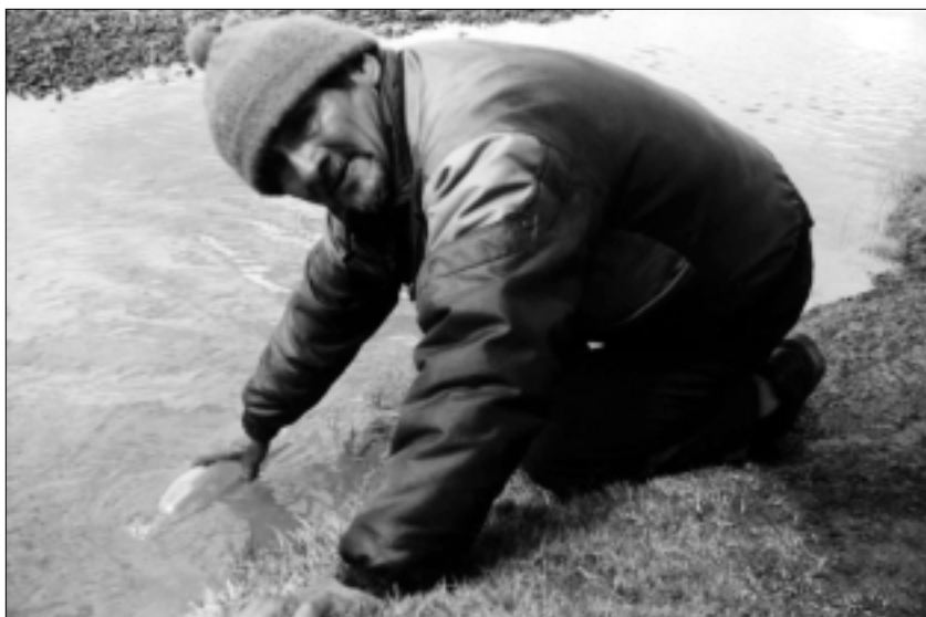
Habitante de La Oroya, Peru, tomando muestras de agua