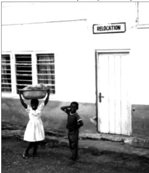
Niños frente a las oficinas de Ghana Goldfields Ltd., Tarkwa, Ghana.