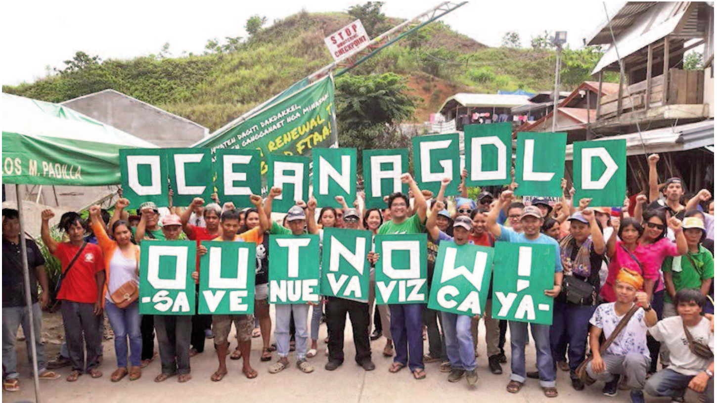
Les habitants de Didipio bloquent l'accès à la mine OceanaGold dans la province de Nueva Vizcaya, aux Philippines.