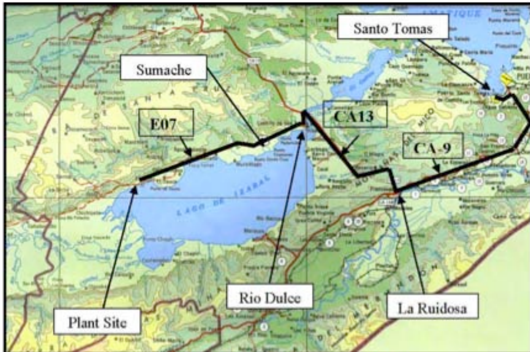
Figure 18-6: Bulk Material Transport Route

En el inicio, CGN ha planificado de transportar materiales a granel vía barcaza desde el Puerto de Santo Tomas por Río Dulce y después por el Lago de Izabal, o de transportar materiales por tierra desde el Puerto de Santo Tomas hasta Mariscos y después de cruzar el Lago Izabal con barcaza. Estas propuestas han sido cambiadas por impactos ambientales “percibidos” de utilizar transporte del Río y del Lago Izabal.